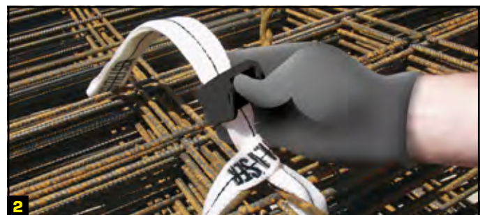
2 Faire coulisser l'ensemble au maximum, le plus près possible du paquet de treillis. Verrouiller le système Li-1 en appuyant sur la partie supérieure de la pièce. Enfoncer le poussoir jusqu'au "CLIC".