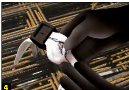
4 Il est impossible d'enlever l'élingue sans la détruire, devenant alors inutilisable.