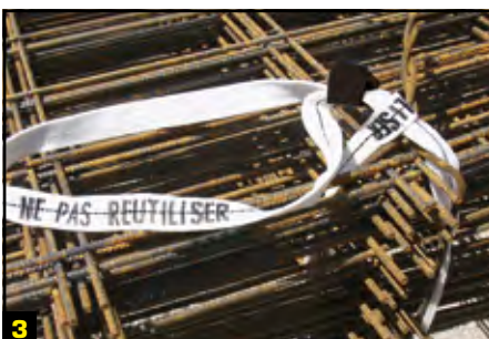
3 Le système est en place et opérationnel.