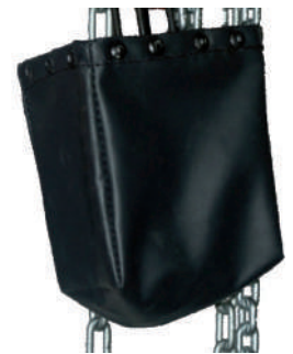
Option: bac pour chaîne de levage